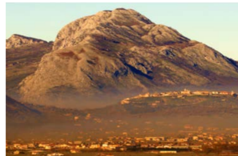
칠렌토-발로 디 디아노 및 알부르니(이탈리아)