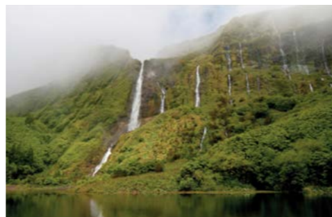
아조레스, 플로레스 섬(포르투갈)