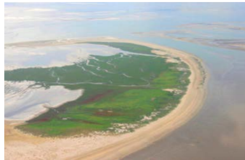
로우어 삭소니 바덴 해 국립공원(독일)

Schaaf, T. and Clamote Rodrigues, D. (2016). Managing MIDAs. IUCN